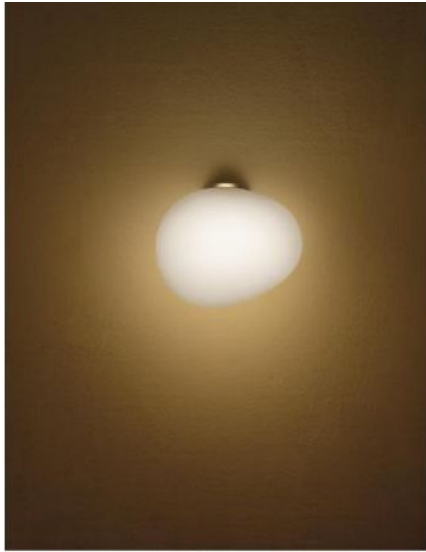
Available Versions Erhältliche Ausführungen