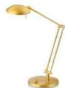
61.619.xx Tischleuchte / table lamp 8,5W, 2900K, 1.115 lm EEL-D