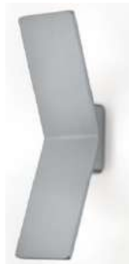
21.852.xx 2 x 10 W, ges. 1.700 lm, 2.700 K EEL-F