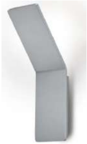
21.851.xx 10 W, 850 lm, 2.700 K EEL-F