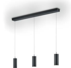
HELLI Pendant lamp 51.511.xx 6 x 8 W LED, 2.700 K, 4.280 lm, EEL-E