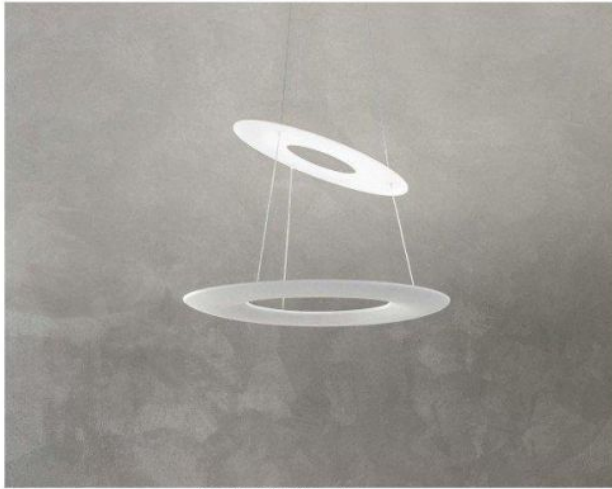
Available Versions Erhältliche Ausführungen